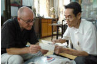
Giáo sư Larry Berman và Phạm Xuân Ẩn ở Sài Gòn